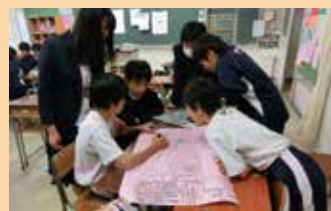
災害の時だけでなく、日常の安全も点検しながら（幸町中）

大きな災害に襲われたときに一番大切なのは、自分の命をどのようにして守るかということである。私たちが身を持って体験したあの災害が「恐ろしかった…」だけで終わらせないようにするために、日頃から自分はどのように行動したらよいか考えておこう。