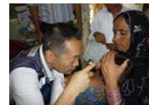
パキスタン洪水被害での 医療チーム