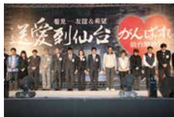
台南市（台湾）で開かれたチャリティイベントには、1,000人以上の市民が参加

アカプルコ市（メキシコ）では市長や交流団体によるいのりがさげられ、オウル市（フィンランド）では留学生が中心となりチャリティイベントが開かれました。またミンスク市（ベラルーシ）は、被災した生徒・児童をミンスクに招待してくれました。