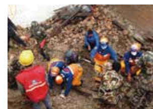
ネパール大地震での 救助活動

青年海外協力隊で知られる国際協力機構 JICA は、海外の被災地に国際緊急援助隊（JDR）を送り、被災者の救助、治療などを行っています。