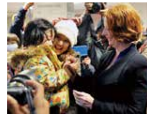
被災者をはげます オーストラリア首相

震災後は、多くの国々からの支援と、緊急援助隊や医療支援チームによる被災地救援の活動が行われました。