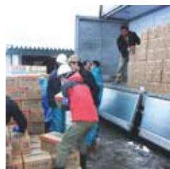
長春市（中国）から支援物資としてとどいた飲料水