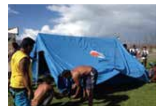
フィリピン台風被害への テント供与