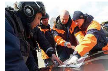
ロシア救援チーム