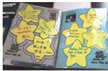
ダラス市（アメリカ）から寄せられた応援メッセージ