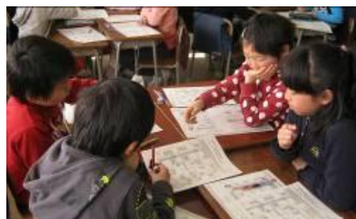
お互いの考えた避難経路について話し合う