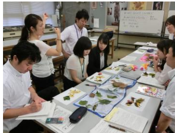
模擬授業の様子(図工・美術)

次の先生からは、「5年次の先生方の指導を見て大変勉強になりました。教材研究が大切であることを、身をもって実感できました」という声が聞かれました。