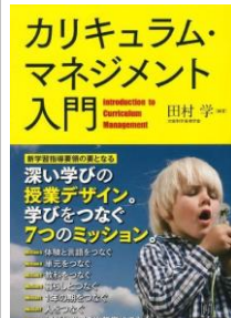
『カリキュラム・マネジメント入門』 田村 学(編集)