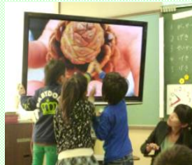
ICT 活用部会提案授業

今年度センターで進めてきた調査研究委員会と教育の情報化研究委員会の研究成果の発表です。各校でOJTを生かして伝講いただき、来年度からの実践にお役立てください。また学年末にはリーフレットを先生方に配布いたします。ご活用ください。