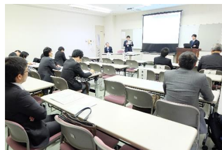
令和元年度教育センター長期研修報告会より