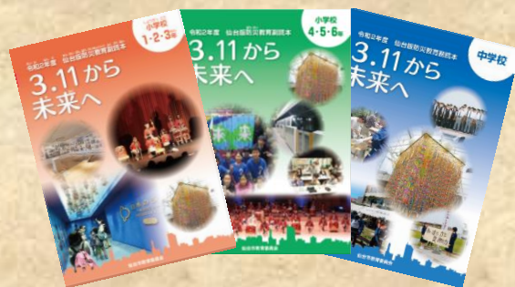
【刊行物「仙台版防災教育副読本」】

教育センター「要覧」 「センター研修 2020」 「仙台版防災教育副読本 3・11 から未来へ」 「仙台の自然」 「わたしたちのまち仙台」 教育研究紀要 「教育はいま」 教育の情報化研究委員会「活動報告書」 「フレッシュ先生研修ガイドブック」 等