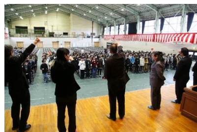
<同窓会入会式より>