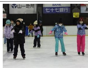
【前に進んでみよう】

今回の活動では、多くの保護者ボランティアの方にもご協力いただきました。児童が笑顔で活動できるように支援していただき、ありがとうございました。