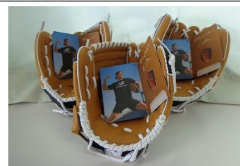
【寄贈されたグローブ】