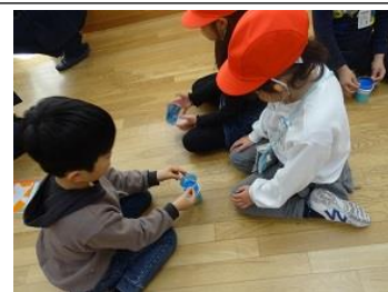
【おもちゃをつかって遊ぼう】