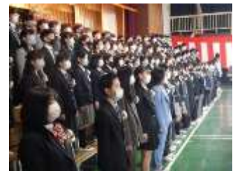
124名、大きくはばたけ！

3月19日(金)卒業式を行いました 今年度の卒業生は第40期生となります。式は、感染防止から、卒業生と教職員、体育館での参列を保護者1名として行いました。「修学旅行が一番の思い出です。」と語っていた6年生。活動が限られる中でも小学校生活最後のこの1年を思い出いっぱいにしてようと校内陸上記録会や体育発表会、音楽発表会など工夫しながら行ってきました。最高学年として、いつも下級生の目標でした。蒲町小で学んだことを誇りに、大きく羽ばたいてほしいと思います。